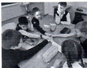
Упражнение «Я люблю»