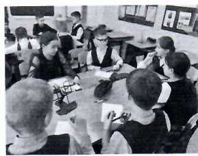
Упражнение «Пять слов о тебе»

IV. Заключительный день Недели психологии пятница прошла под девизом: «Жизнь - это 10 процентов того, что случается с вами и 90 процентов того, как вы реагируете на это»