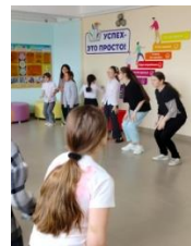
Учащиеся-волонтеры 8-го «б» класса К.Д. Т.У.