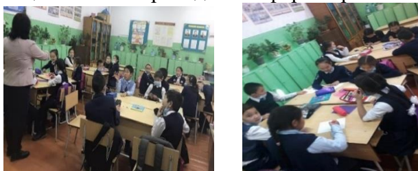
Упражнение «Пять слов о тебе».

Коррекционно-развивающие занятия проводятся в форме тренинга