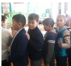
Игра «Пойми меня»