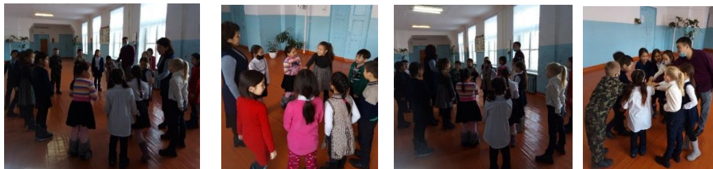
Игра-упражнение «Я люблю»

Проведено психодиагностическое исследование самооценки и выявления степени агрессивного поведения у учащихся по методике «Автопортрет», так же проведена психокоррекционная беседа по высоким, конфликтным взаимоотношениям среди мальчиков, с учащимися проведены игры «Я люблю» и тренинговое упражнение ««Меняются местами все те, кто любит...»».