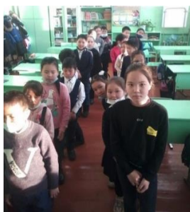
3 «б» кл. упражнение «Пойми меня». Кл.рук-ль Очур С.Б.