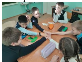
Упражнение «Я люблю»

- содействие сплочению детского коллектива, развитию коммуникативных способностей в процессе групповых работ.