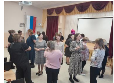
Упражнение «Нравится, не нравится».

Если в начале работы у педагогов наблюдалось настороженность, сниженный эмоциональный настрой на работу, то в конце присутствовало улучшения настроения, все активно играли и шутили.