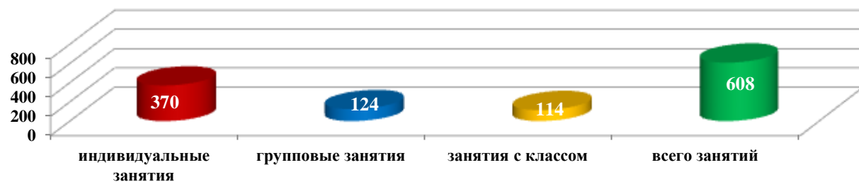
Сравнительная диаграмма количества занятий с обучающимися за год

Занятия на коррекцию взаимоотношений в классе, были направлены на развитие навыков общения и сотрудничества. Стоит отметить, что после проведения такой работы, дети становятся более терпимыми друг к другу. Ребята стали общаться с теми детьми, которые были им менее приятны, многие стараются помочь слабым, защищают их от нападок одноклассников. Конечно, периодически возникают конфликты в классах: неуважение друг к другу, сквернословие, унижение слабых, но таких проблем стало меньше. На следующий год планируется продолжить работу в данном направлении.